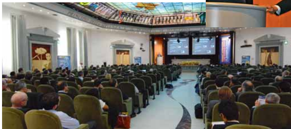
Plenarsaal des Kongresszentrums in Bergamo

BERGAMO (ITALIEN), Mitte Oktober (bv). Idealerweise entsteht Cappuccino aus einem Espresso und rund 40 ml in einer etwa 120 ml fassenden Tasse, der zügig mit halbflüssigem cremigem Milchschaum (mit 50 Prozent Luft) aufgegossen wird. Dieser Wikipedia entnommenen Anleitung wird der Triester ebenso wenig zustimmen wie der Mailänder. Beide norditalienischen Metropolen stellen nämlich so etwas wie zwei Extreme der Milchbeigabe dar: In Mailand wird mehr Milch, in Triest deutlich weniger Milch der edlen schwarzen Flüssigkeit zugefügt. Der Cappuccino ist in Italien allgegenwärtig, freilich nur vormittags, ganztags indes wird der Espresso gereicht, so auch auf der gemeinsam von EnginSoft SpA (Trient) und Ansys Italia (Mailand) veranstalteten Anwenderkonferenz in einer der reichsten Städte Italiens. Rund 500 Experten aus dem industriellen und akademischen Umfeld von Simulation und Berechnung kamen im Centro Congressi zusammen und informierten sich über Ansys und Ansys Workbench ebenso wie über die Optimierungssoftware für multidisziplinäres Engineering, ModeFrontier, die aktuell in der Version 4.1.2 vorliegt. EnginSoft ist exklusiver Channel Partner von Ansys in Italien. Unter dem Motto „CAE-Technologien für die Industrie“ wurde dem schnellen Return on Investment in nahezu allen Vorträgen das Wort geredet. In diesem Geist präsentierten sich pro-